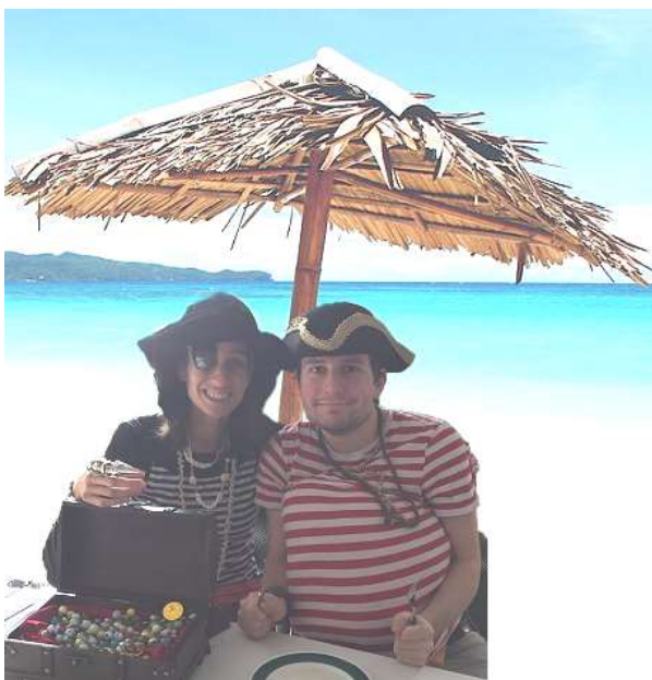
Die Piraten-Insel - Mitspieltheater